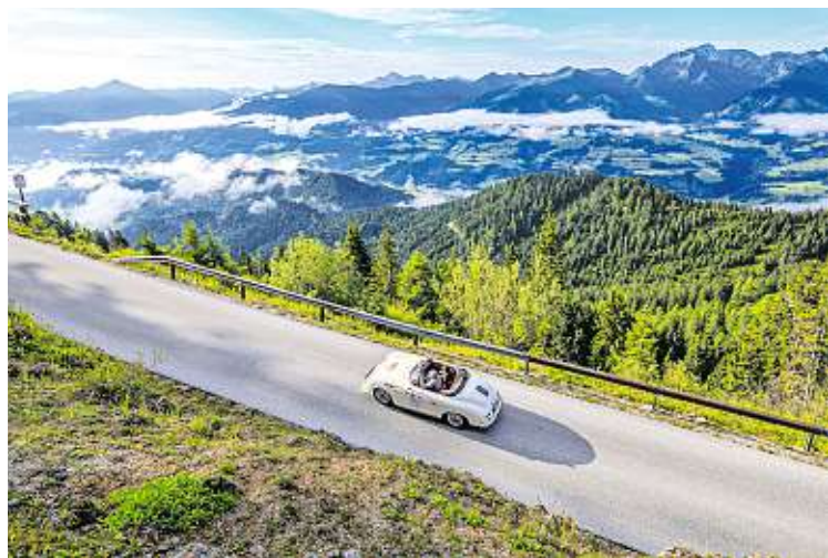
Die Panoramastraße auf den Stoderzinken gewährt einzigartige Ausblicke.

Rechts: Auch auf den Hauser Kaibling kommst du mit der Steiermark-Card gratis rauf