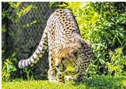
Oben: Sommerrodeln mit dem Rittisberg Coaster Links: Geparden beobachten in der Tierwelt Herberstein

Mit der Kabinenbahn geht es hinauf auf 1.350 Höhenmeter. Der Waldseilgarten gliedert sich in verschiedene Ebenen auf 6 Parcours und bietet ein Vergnügen für alle Kletterbegeisterten.