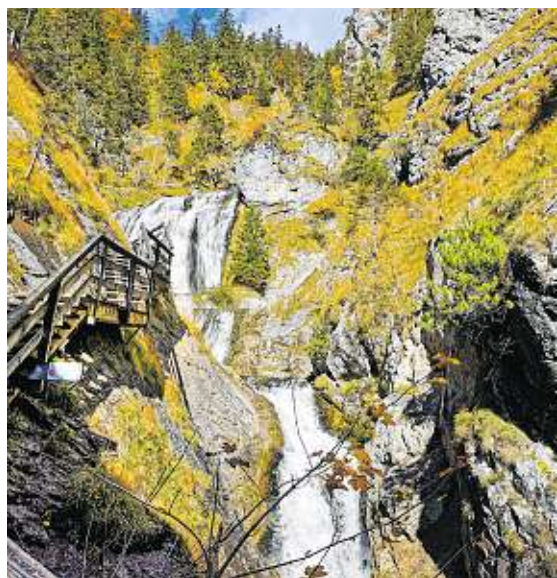
Links: die Wasserlochklamm Palfau

Der Waldseilgarten Hirschenkogel ist einer von 32 Ausflugszielen der Rubrik „Freizeit“