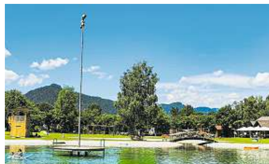
Der Freizeitpark Badensee Landl im Gesäuse

kannst du dein Badetuch auf einer großzügigen Liegewiese ausbreiten, mit dem Tretboot fahren, Beachvolleyball oder Tischtennis spielen und die 18-Meter- oder die Breitwasserrutsche stürmen. Weitere Steiermark-Card-Partner sind unter anderem das Wellenbad Gleisdorf und das Freibad Fürstenfeld.