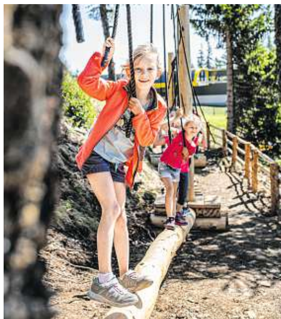
Grosseck-Speiereck ist einer von 19 Partnern der Steiermark-Card in der Rubrik Berg & Bahn

nostalgische Zugfahrt durch das Schilcher-Kernöl-Land mit dem legendären Stainzer Fläschlerzug von Stainz nach Preding und retour. Sonntags gibt es bei jedem fahrplanmäßigen 15-Uhr-Zug auch ein abwechslungsreiches Kinderprogramm!